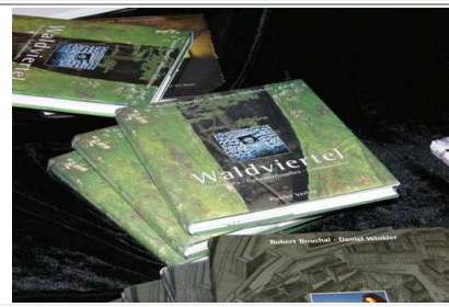
Wr. Neudorf