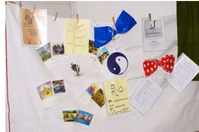
Qi Gong Workshops für Kinder und Erwachsene Elisabeth Bruckner; Gießhübl